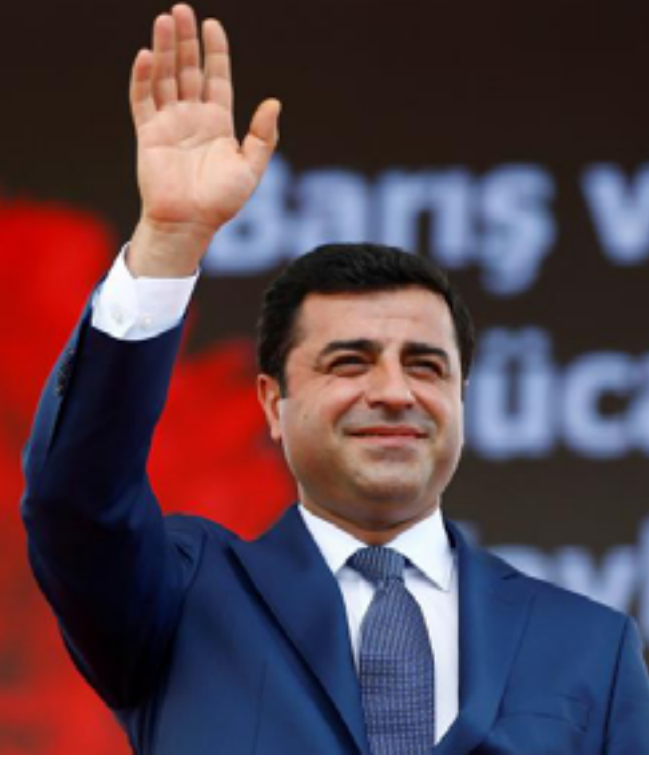
Barajda tek başına