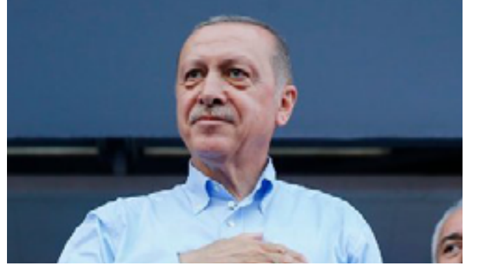
Cumhurbaşkanının iki şapkası