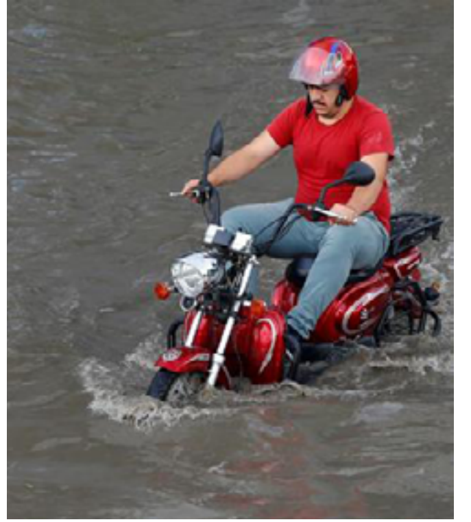
Hangi partinin iklimi daha güzel?