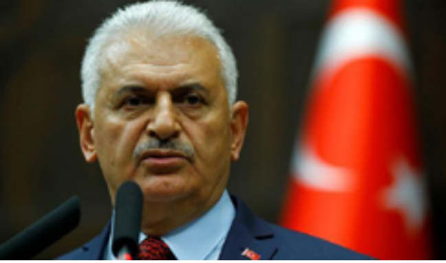
Emanetçi başbakan olmanın önemi